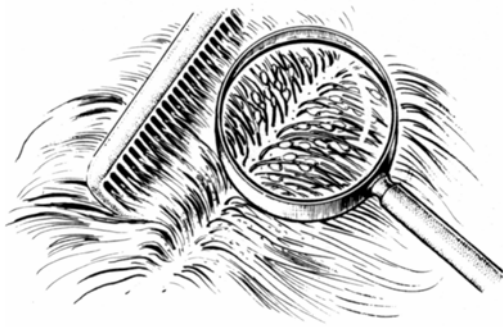
uma cabeça com lêndeas

Imagens recolhidas da Direção dos Serviços de Saúde de Wiesbaden: