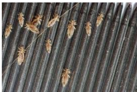
um pente para pioelhos

Alguns erros no tratamento que podem favorecer a sobrevivência dos ovos, das larvas ou dos pioelhos são a aplicação do produto em quantidade insuficiente, um tempo de atuação demasiado curto, a incorreta distribuição do produto, o uso de um produto demasiadamente diluído em cabelos demasiadamente molhados ou a falta de repetição do tratamento.