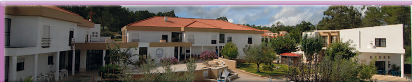
Centro de Reabilitação do Desafio Jovem em “Castanheira do Ribatejo”.