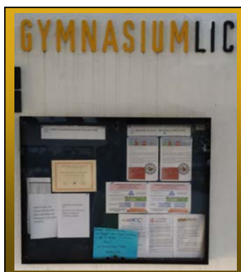
Painel Informativo das AGs