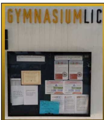
AG- Schaukasten für aktuelle Informationen